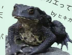
無事カエってね！ by ヒキガエル

このコースには、沢や川を渡る場所があります。石を選びながら渡れば濡れることは少ないですが、増水時は特に足元に注意！川の流れが速かったり、危険だと思ったら無理をせず、引き返すようにしましょう。また、慌てて滑って転ばないように！万が一濡れたときのために、予備の靴下やタオルがあると安心です。