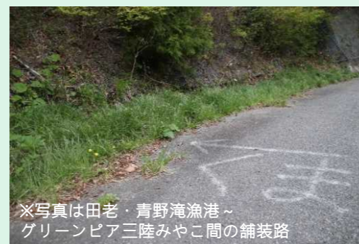
※写真は田老・青野滝漁港 ~ グリーンピア三陸みやこ間の舗装路